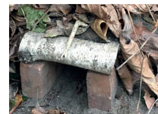
egelhuis van stenen en takken