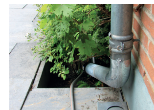
Regenwater stroomt de tuin in