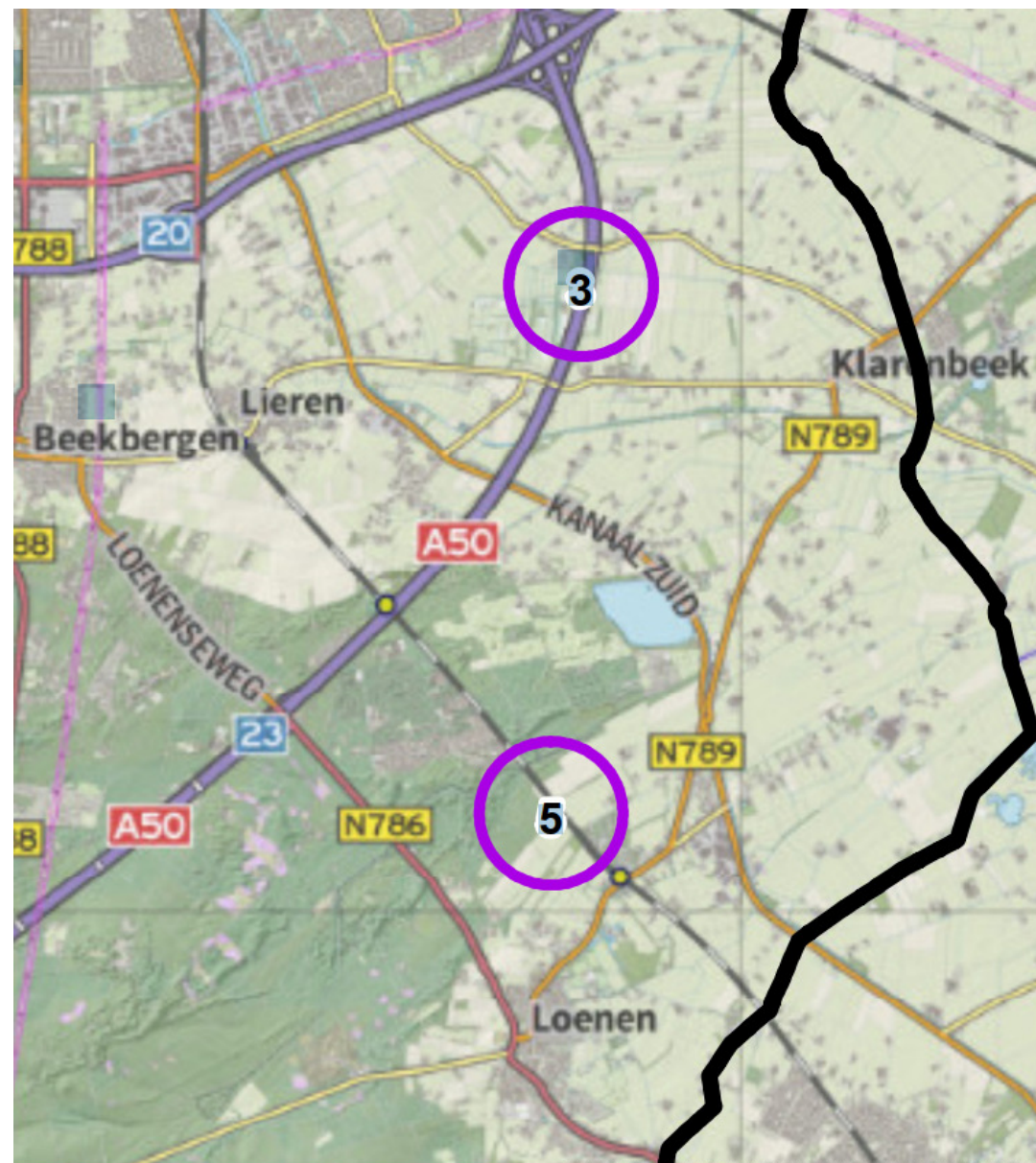
Indicatie van het aantal windturbines per locatie