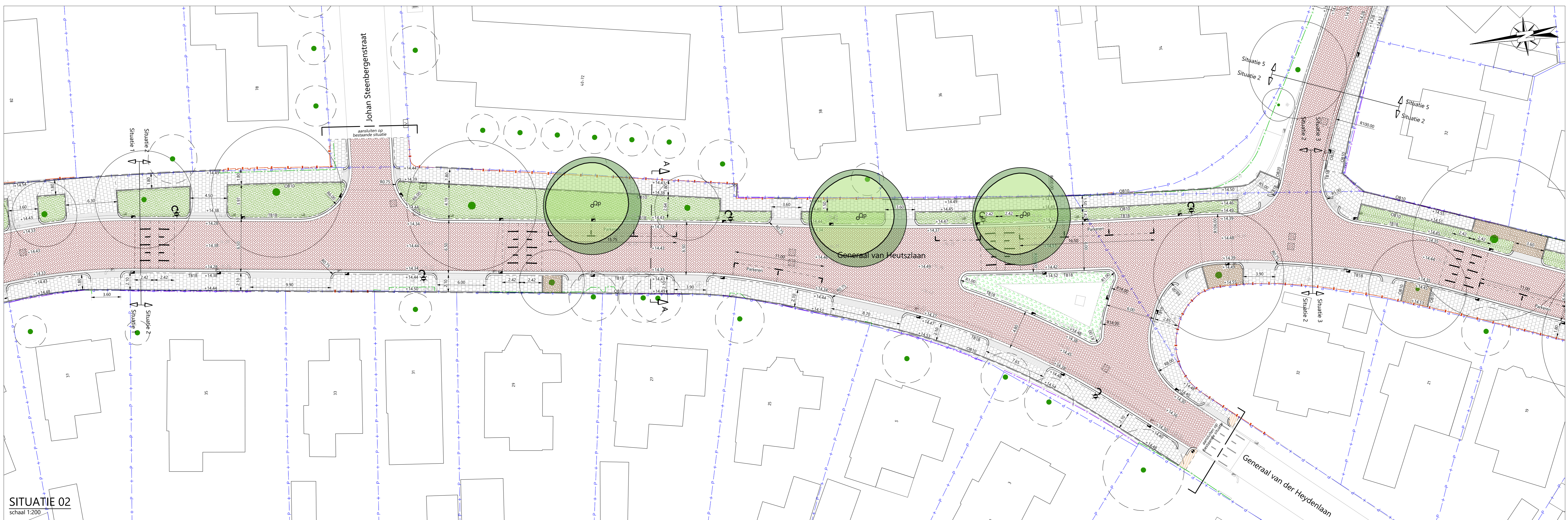
SITUATIE 02 schaal 1:200