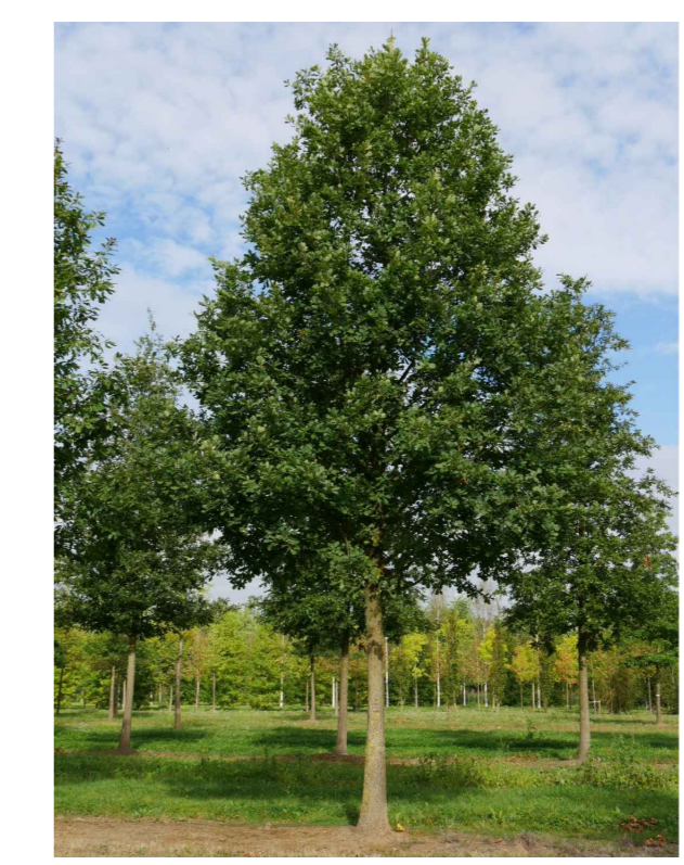
Impressie boomkeuze Generaal van Heutszlaan Quercus petraea (wintereik), afkorting: Qp