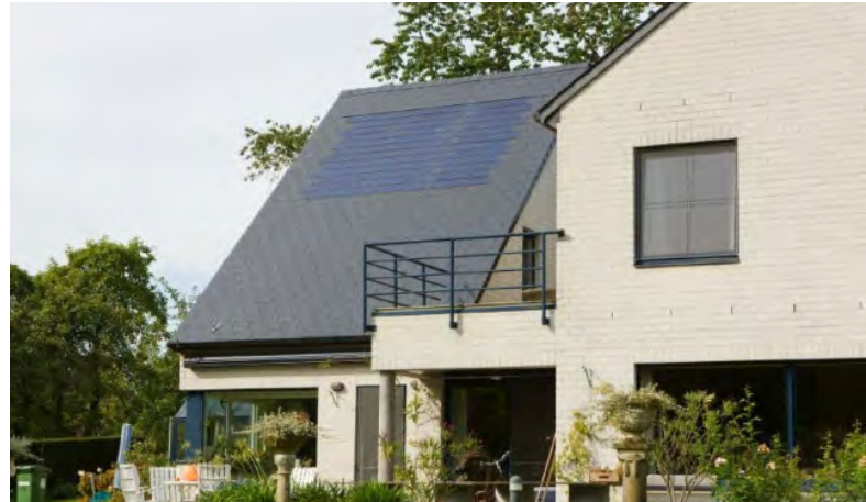
Plaats zonnepanelen aan de niet-straatgerichte zijde van het dak (als dat op de zon gericht is)

DEZE TIPS GELDEN NATUURLIJK OOK VOOR WONINGEN DIE NIET IN EEN BESCHERMD GEBIED STAAN!